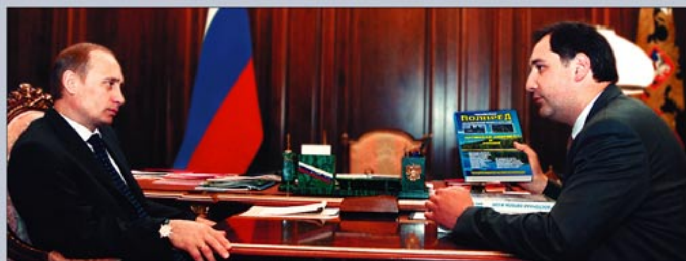
7 июня 2001 г., Москва. Президент РФ Владимир Путин встретился с председателем Комитета Государственной Думы по международным делам Дмитрием Рогозиным. На снимке: Дмитрий Рогозин во время встречи вручил Владимиру Путину серию изданий Комитета по международным делам, в том числе несколько томов энциклопедического сборника "Полпред", призванного обеспечить качественной информацией мелких и средних предпринимателей, начинающих заниматься внешнеэкономической деятельностью.