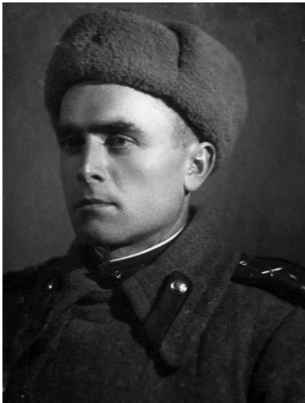
Автор в 1943 г.