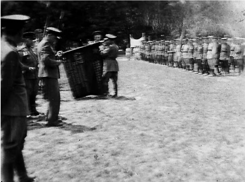
Вручение 432-му полку гвардейского знамени. 1944 г.