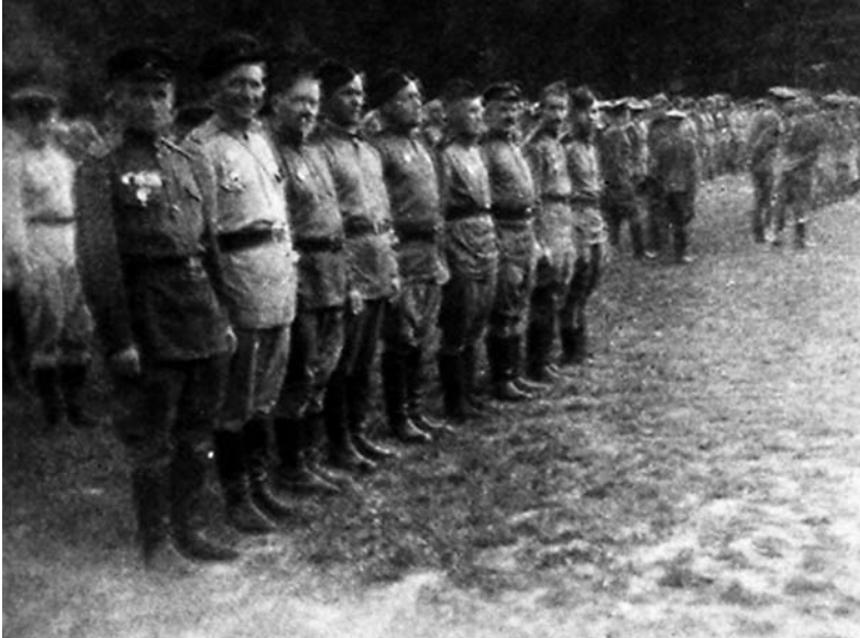
432-й полк на построении (первый слева — автор)