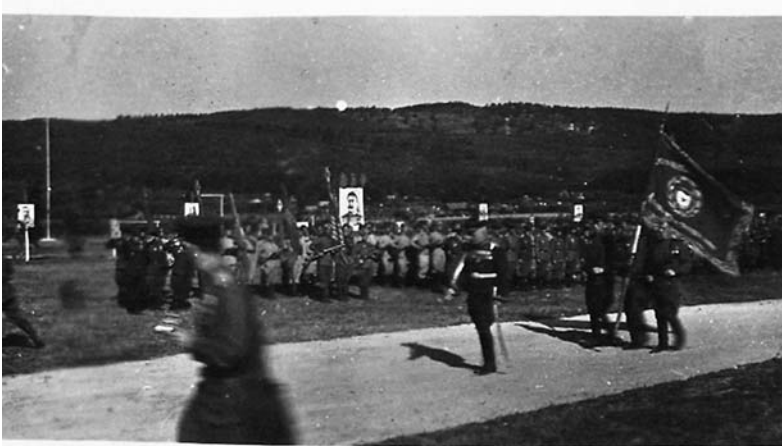
Парад Победы 6-й гвардейской танковой армии. Возглавляет генерал Лелюшенко Д. Д. Австрия, июнь 1945 г.