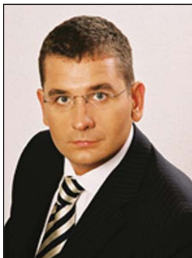
Приветствие министра экономики и транспорта Венгрии, доктора Яноша КОКА читателям издания «Деловая Венгрия»

Надежда, связанная с тем, что членство Венгрии в Европейском Союзе — вступившее в силу 1 мая 2004г. — окажет положительное влияние на венгерско-российские связи, получила свое подтверждение.