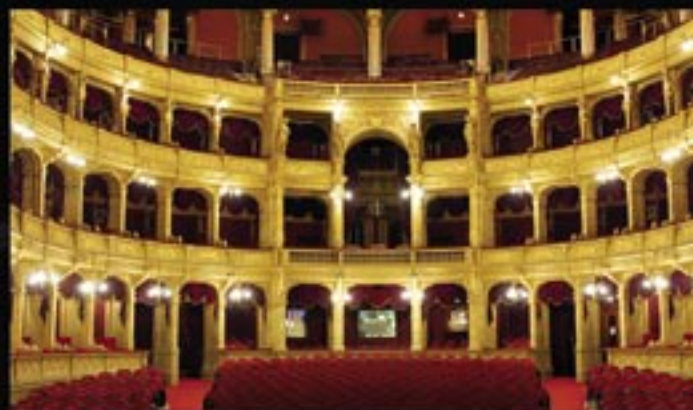
Будапешт, Венгерская Государственная Опера